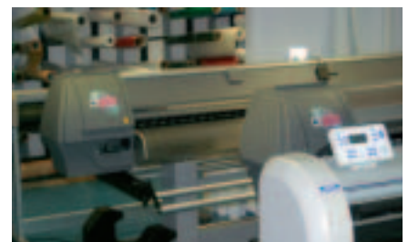
Die Mutoh Maschinen sind bei Wagner oft rund um die Uhr im Einsatz.

wurden ideal kombiniert. Die für die Abwicklung bei Beschriftern typischen Arbeitsabläufe analysiert und dem betrieblichen Workflow angepasst. In Hof werden heute LKW und PKW-Beschriftungen, Scheibenfolien und Spezialfolien für Flachglas, Transparente und Schilder sowie Beschriftun-